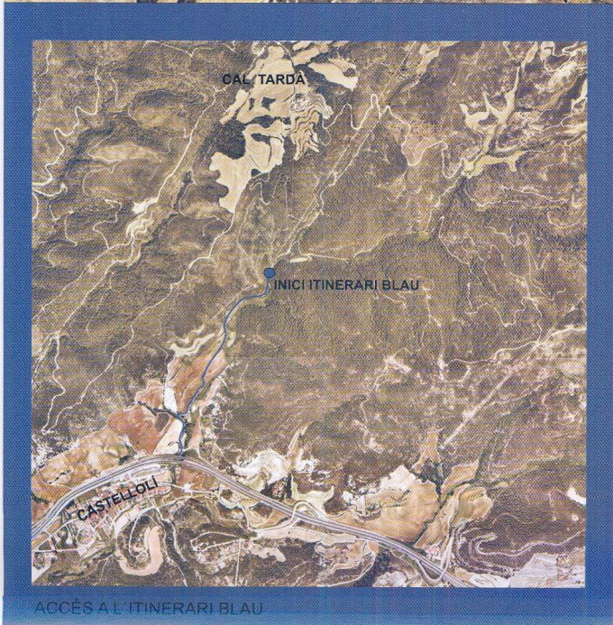
ACCÉS A L'ITINERARI BLAU